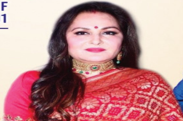
GRAND MARSHAL JAYA PRADA