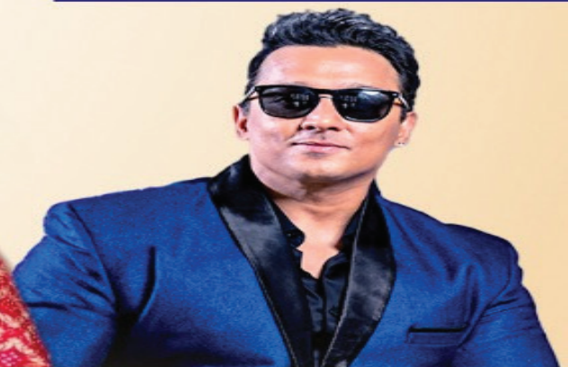
CELEBRITY ROCKSTAR REX D'SOUZA