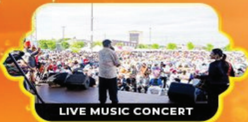
LIVE MUSIC CONCERT